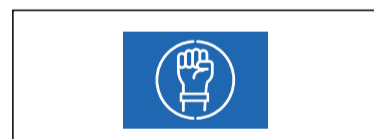
выворотка (макет на фоне)